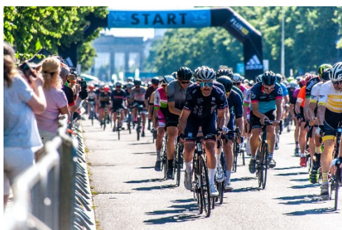
Kurs auf Oldenburg? Die CDU-Fraktion setzt sich für ein Radrennen in der Stadt ein.