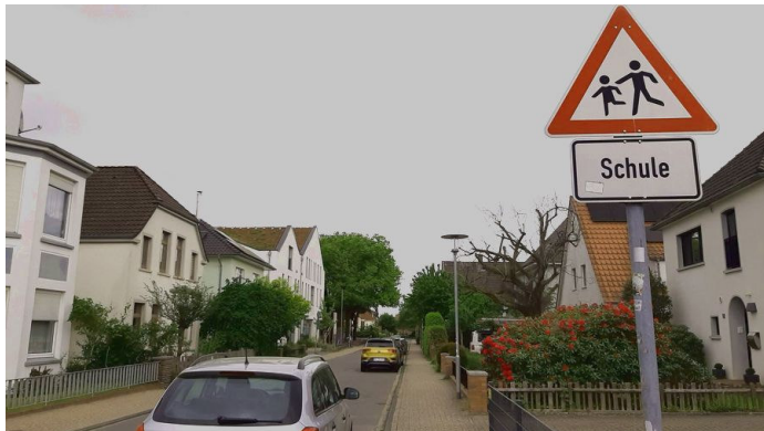
Wird künftig zur temporären Schulstraße: Die Junkerstraße im Bereich der Grundschule Bürgeresch.

Es geht auch bürgerfreundlich und unbürokratisch: Auf politischen Druck - unter anderem durch die CDU-Fraktion - werden die Anwohner der Junkerstraße nun doch nicht für eine Sonderfahrgenehmigung zur Kasse gebeten. Hintergrund ist das Pilotprojekt „Schulstraße“. Nach Plänen der Verwaltung sollten die Anlieger für das Befahren während der geplanten Sperrzeiten morgens und nachmittags einen kostenpflichtigen