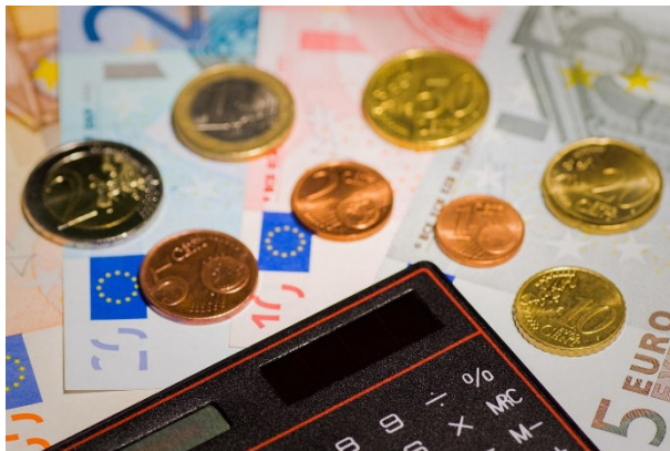
Der Haushalt 2026 wurde mit den Stimmen der CDU-Fraktion beschlossen.