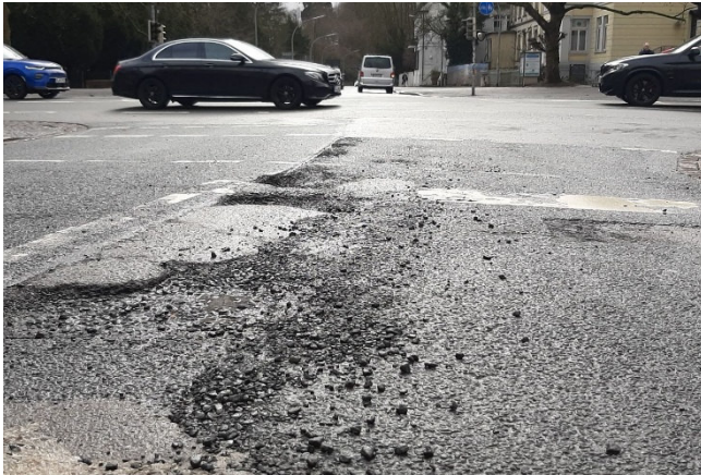
Loch an Loch: Die Oldenburger Straßen geben aktuell kein gutes Bild ab.

Ausgedehnte Risse und tiefe Schlaglöcher: Oldenburgs Straßen gleichen nach den frostigen Winterwochen einer Kraterlandschaft. Die soll in diesem Frühjahr so schnell wie möglich behoben werden, fordert die CDU-Fraktion in einem Antrag für die Märzsitzen von Verkehrsausschuss und Rat.